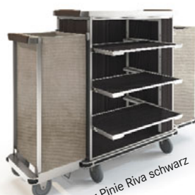
Holzdekor Pinie Riva schwarz