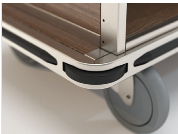
Integrierte Abweisrollen: Nicht abfärbende Abweisrollen sind in den Rahmen integriert und erleichtern die Navigation ganz ohne Streifen an den Flurwänden.

KANN DIE SYMBIOSE VON FUNKTION UND TECHNIK SCHÖN SEIN? SIE KANN!