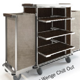
Holzdekor Wenge Chill Out