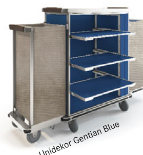
Unidekor Gentian Blue