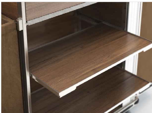
Ausziehbare Böden: Diese mit Anti-Rutsch Beschichtung ausgestatteten Tablare lassen sich bis zur Hälfte nach vorne ziehen und komfortabel mit Wäsche beladen.