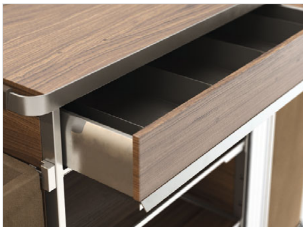
Schublade mit Soft Close Mechanismus: Leises und schnelles Schließen wird von diesem praktischen, intelligenten System unterstützt.