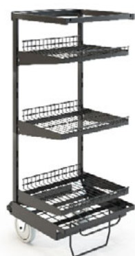
viPush Cartless Wagen