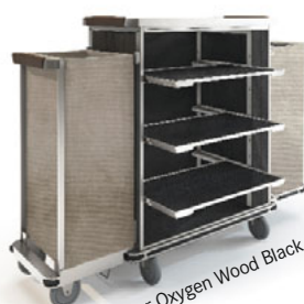
Holzdekor Oxygen Wood Black