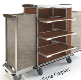
Holzdekor Birne Cognac