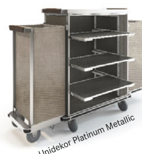
Unidekor Platinum Metallic