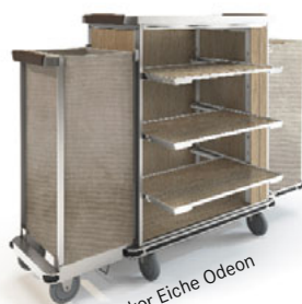
Holzdekor Eiche Odeon