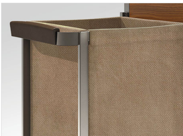
Textile Abdeckungen: Die seitlichen Ausleger für Schmutzwäsche und Müll sind mit hochwertigen Textilverdecken in passendem Design verdeckt und kreieren einen durchgängig sauberen Auftritt.