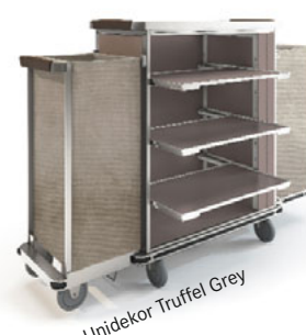
Unidekor Truffel Grey